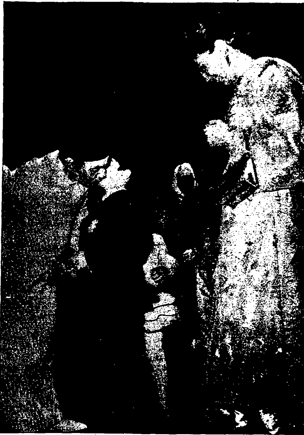
جللة الملك الحسن الثاني مع الفلاحين ببلدية نواكشوط في ايام زيارته الى الريف (مسيرة الفلاحين)